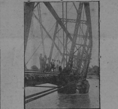
En la situación que quedó ese puente con el temporal anterior

En la de S. Antonio cayó un sterro. Pasa a la ga. página