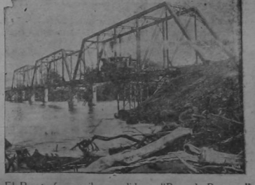
El puente ferroviario perdido en "Boca de Barranca"